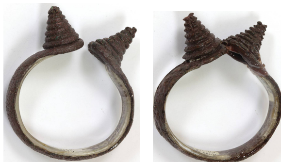
Рисунок 4 – ЦМК КП 26221/28,29