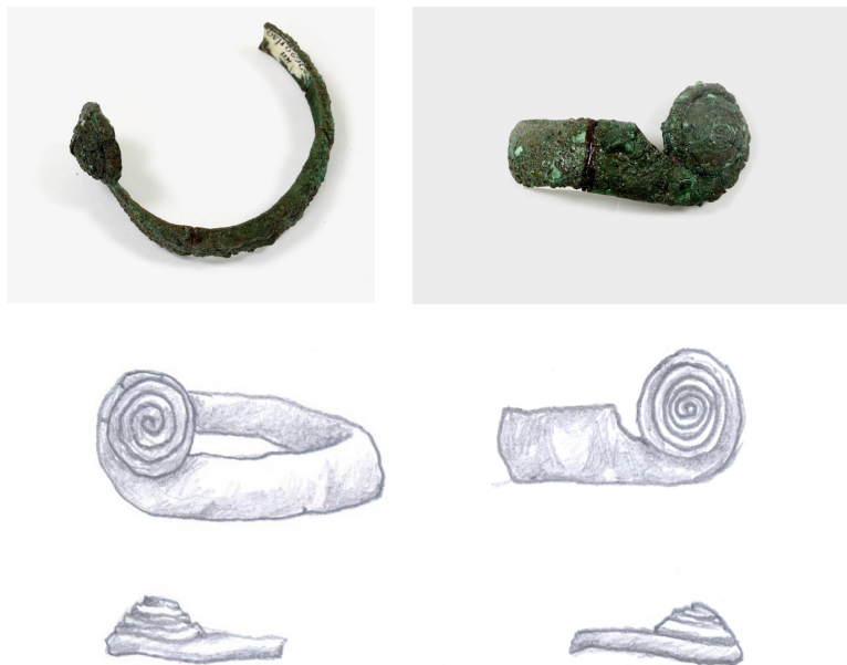
Рисунок 1 – ЦМК КП 26221/30

Схожие браслеты (ЦМК КП 20253/1-6, рис. 2) также переданы в 1985 г. в фонд Центрального государственного музея археологом Э.Р. Усмановым из музея археологии и этнографии Карагандинского университета на основании приказа Министерства культуры Каз ССР. Вернее, это фрагменты браслетов из бронзы: имеются части выпукло-вогнутого ободка шириной 0,6 см и три – со спиралевидными щитками, где щитки не высокие, диаметром от 1 см до 1,5 см. Из-за плохой сохранности определить количество завитков спирали невозможно, но по размеру ободка можно определить, что браслет был небольшого размера, возможно, предназначенный для девочки-подростка. Э.Р. Усманова считает, что даже дети (видимо, девочки) хоронились с браслетами, при этом, зачастую не имея других женских украшений [1, с. 150]. К тому же по некоторым данным исходная форма браслетов с плоскими коническими спиралями восходит к петровским или нуртайским комплексам, как Улубай, Нуртай и Графские развалины [3, с. 69-70].