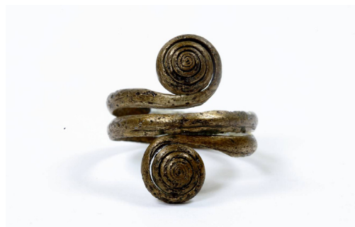
Рисунок 5 – ЦМК КП 26221/26

свинцовых рудников. К тому же, во многих поселениях были обнаружены разные литейные формы, тигли, каменные абразивные орудия для заточки бронзовых предметов. Об этом свидетельствуют и сами поселения: самые яркие металлургические комплексы исследованы на поселении Атасу. Во многих жилищах выявлены очаги, а также более сложные конструкции. Вся площадь поселения Атасу изрыта рвами, канавами, ямами, связанными с металлообработкой, а на его поверхности много руды, шлаков, слитков меди, рудодробилок. Исследователь М.К. Кадырбаев подчеркивает, что печи поселения Атасу имели разную конструкцию, обусловленную различным функциональным назначением.