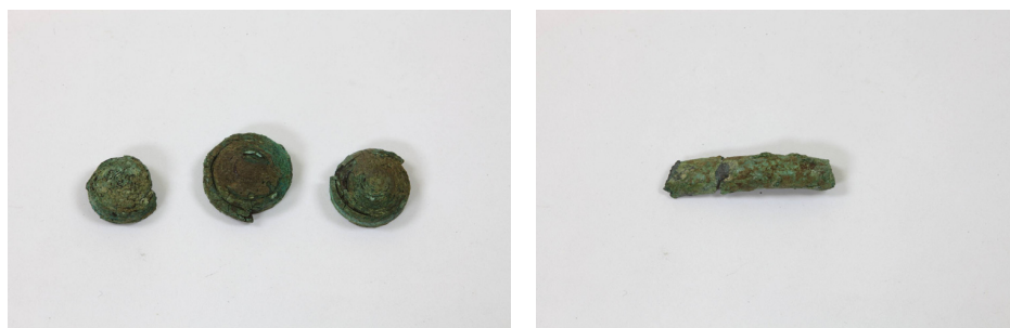
Рисунок 2 – ЦМК КП 20253/1-4