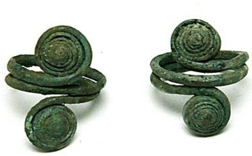
Рисунок 6 – КП 1490 (г. Костанай)

Таким образом, можно утверждать, что в андроновском ареале изделия из металла в большей степени изготавливались способамиковки и литья. Для украшений применялись тиснение и чеканка. Использовались одностворчатые и двустворчатые литейные формы, а в эпоху поздней бронзы трехстворчатые сделанные из камня и глины [13, с. 147]. Подводя итоги, можно сказать, что описанные браслеты представляют собой наиболее распространенную группу браслетов племен андроновского ареала, их характерные признаки позволяют судить о местном производстве