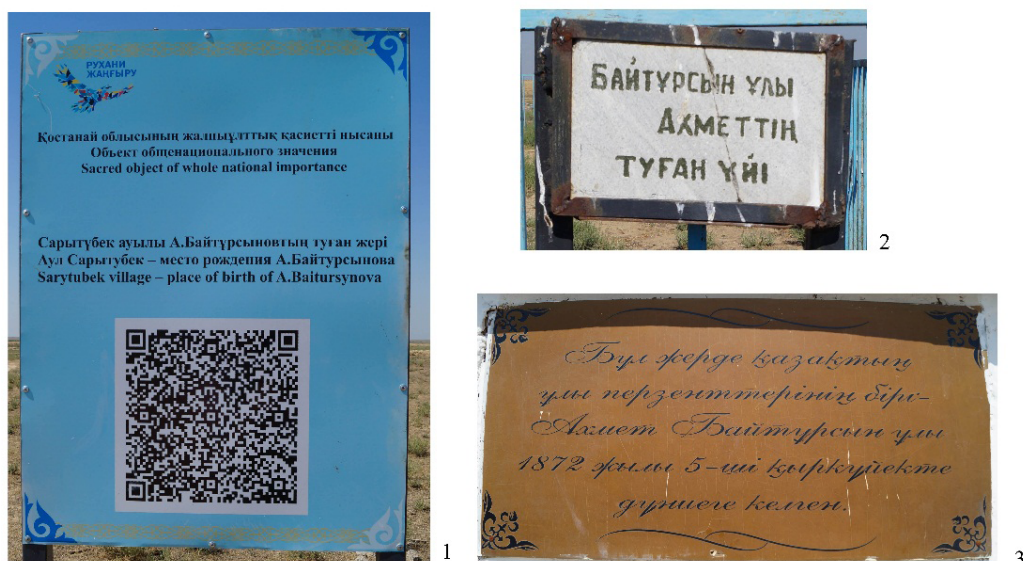
Рисунок 3 – Зимовка Машен. Содержание надписей на табличках. 1 – на шите, установленном на памятнике; 2 – на ограждении; 3 – на стене дома