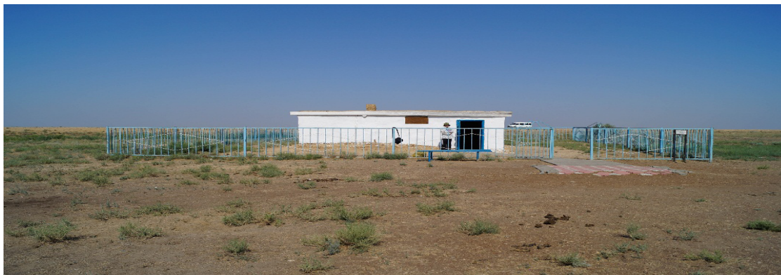
Рисунок 2 – Восстановленный дом семьи Ахмета Байтурсынова на зимовке Машен

становлен дом. Инициатором этого мероприятия является известный аркалыкский краевед Елена Цвентух (Первухина, 2019) (рис. 2).