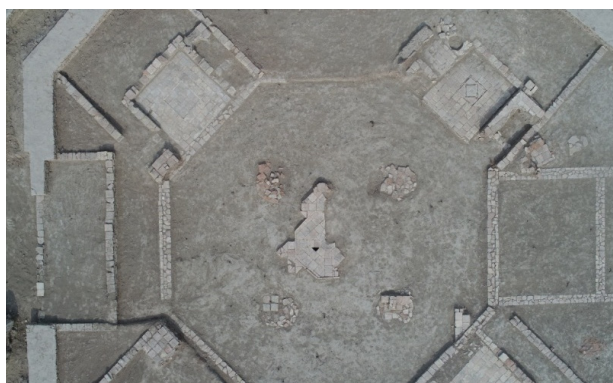
3-сурет – 8-бөлмедегі суағар