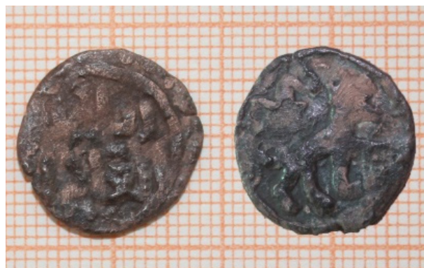
4-сурет – Медреседен табылған тиын

Тиынның шыққын жылы мен нақты кімге тиесілі екендігі жазылмаған. Таңбалуы мен көлеміне қарағанда Жошы Ұлысының заманына сәйкес келеді. Салмағы 1,62 г, көлемі 16,5-16,6 мм. Оң бетінде екі қатар: «әл әділ / әл сұлтан» (әділ / сұлтан) деген жазуы, теріс бетінде құйрығы мен басын көтеріп келе жатқан жыртқыш аңның