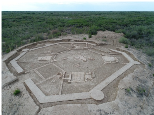
1-сурет – Медресенің жалпы көрінісі

Ашылған құрылыстың сыртқы қабырғаларының ұзындығы 7-14 м аралығында, ені 1 м, сақталған биіктігі 5-60 см, сыртқы және ішкі жиектері 26 \times 26 \times 4-5 см, 27 \times 27 \times 45 см өлшемдегі бүтін кесектермен қаланып, олардың арасы қою лай араластырылған кесектердің сынықтарымен толтырылған. Құрылыстың төрт бұрышында симметриялы орналасқан диметрі 1,7-1,9 м болатын мұнаралары бар. Барлық мұнаралардың сыртқы жиектері 20 \times 20 \times 10 см, сыртқы қыры доғалдау етіп арнайы құйылған кесектермен өріліп, ортасы лай араластырылған кесек сынықтарымен толтырылған.