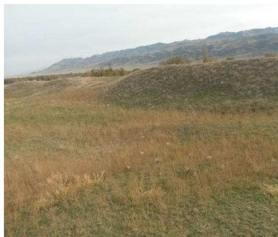
1, 2-сурет – Орта ғасырлық Саға-Бүйен қаласының солтүстік-батыс көрінісі