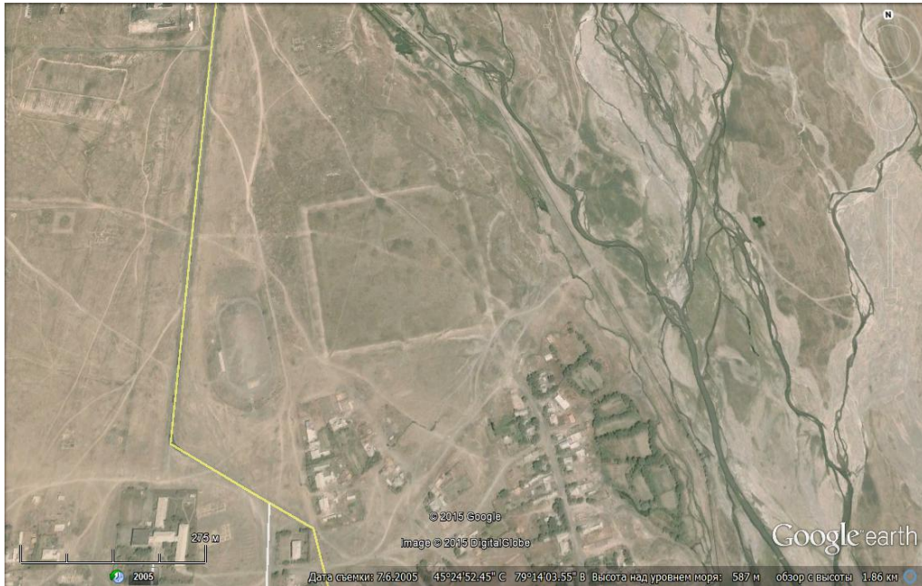
5-сурет – Саға-Бүйен қалашығының аэрофотосы

оюлы күйдірілген сары сазбен безендірілген кесенелерді, сонымен қатар кесенелерге жақын орналасқан ханаканы ашумен белгілі. Ендеше Қойлық қаласына қатынау шығыс-батыс бағытта Саға-Бүйен қаласы арқылы өтетіндіктен, көне қалашықты зерттеу тарихтың құпия сырларын парақтары сөзсіз. Сонымен қатар аталмыш елді мекенге тиеселі тарихи кезеңдердегі жергілікті байлардың атымен аталған Күркебай, Есімбай, Оңғарбай қыстаулары, ара қашықтығы шамамен 140-200 шақырым, малшы қауым атпен көшкенде орта есеппен 4-5 күнді құрайтын, баурайы рауғаш, таусарымсақ, қой бұлдірген, таңқурай, жабайы сиыр бұлдірген, барбарис және т.б. көптеген өсімдіктерге толы Сарықора, Көпірлі жайлауларын туризмнің орталығына айналдырсақ, еліміздің игілігіне жұмыс істері анық.