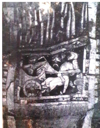
3-сурет – Батыс Қазақстан облысы. Тақсай I қорған кешені. Ағаш тарақта бейнеленген екі дөңгелекті арба