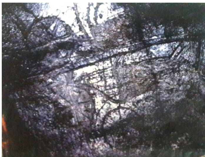
2-сурет – Алматы облысы. Ешкіөлмес петроглифтері