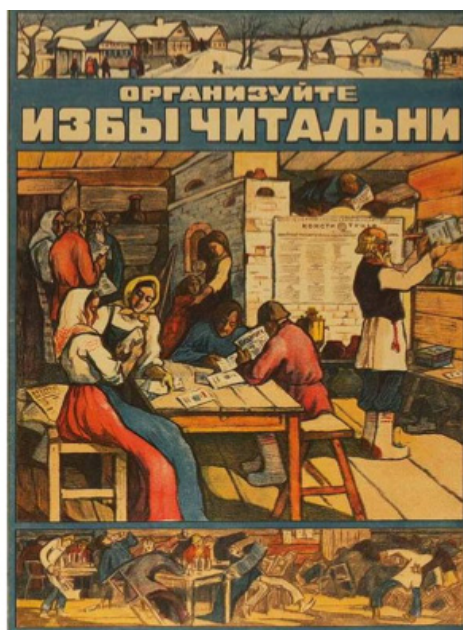
1-сурет – «Неграмотный — тот же слепой. Всюду его ждут неудачи и несчастья» (сол жақта), «Организуйте избы-читальни» (оң жақта) (Е.Игнатович, 2021:12).

1-ші суреттен кеңес үкіметінің қараңғылықтың көлеңкесінде күн кешіп, оқуға ынтасы жоқ шаруаларды жаңа мемлекетте ұйымдастырылған оқу-үйлерінен сауат ашуға үгіттеу саясатын көре аламыз. Кеңес үкіметі сауатсыздықты толығымен жою үшін, тек мектептердің жеткіліксіздігін атап, оқу-үйлері бұл процеске белсенді қатысуы керек деп болжады. Олар негізінен ауылдық жерлерде шоғырланғандықтан, барлық жастағы ауыл тұрғындарының бос уақыттарын әртараптандыруы керек еді. 1920 жылдардағы кітапхана жүйесінің элементі бола отырып, оқу-үйлері ауылдағы негізгі саяси білім беру мекемесінің функцияларын атқарды. Сондықтан оқу-үйлерінде сауатсыз ауыл тұрғындарын білім алуға баулумен бірге, оларға биліктің идеологиялық саясатын дәріптеу жұмыстары да қатар жүргізілді.