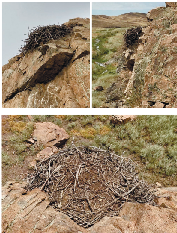
6-сурет. Жартас қиясындағы бүркіт ұясы. Алматы облысы, Еспе шатқалы. АЭМ – 2022 ж, күз