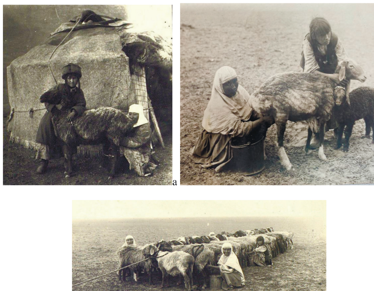
2-сурет. Қой сауу. Верный уезі, П.А. Лейбин фотосы, 1913 ж.: а) МАЭ И 1292-13); ә) Лейбин альбомы, №22; в) МАЭ И 1292-14; Васильев 1915, 156 а.

П.А. Лейбиннің аталмыш альбомға енген «Қой сауу» деп аталатын фотосында шешесі мен қызының қой сауу кезі жеке бір қойды сауу кезінен түсірілген (2 ә сурет). Ал П.А.Лейбин өзінің әріптесі В.А.Васильевке топтық қой сауу үрдісін ұсынады (2 в сурет; Васильев 1915, 156а). Фотода елу шақты сауын қойын екі жаққа бөліп бір желіге көгендеп байлап, 4 әйелдің қатар сауып отырғанын көруге болады. Далалық зерттеулер кезінде сұхбаттасқан «дерек кісілер» Жетісу өңірінің жайлауларында қойды көгендеп сауу ХХ ғасырдың 60-70-ші жылдарына дейін жалғасқанын айтады. Қазіргі таңда қойды көгендеп сауу бұл өңірде қолданыстан шыққан.