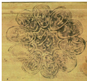
1-сурет – ҚР Ұлттық кітапханасы қорынан жарияланған брошюрадан алынды

Мақала Қазақстан Республикасы Мәдениет және спорт министрлігінің «Қазақстандағы рухани жерасты мешіттерінің тарихы және «Қылует» жерасты мешітін музейлендіру» (жеке тіркеу номері: BR10164268) тақырыбындағы бағдарламалық-нысаналы қаржыландыру жобасын жүзеге асыру аясында орындалды.