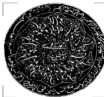
3-сурет – П.Н. Ахмеровтың «Описание печати Ахмеда Ясави» зерттеуінде қарастырылған мөр