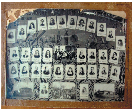
Рисунок 5 – Кустанайский педагогический техникум. Выпуск первый. 7 февраля 1927 г. ГАКО.

Сохранились уникальные фотоснимки первого выпуска Кустанайского педтехникума 1927 г., где пофамильно указаны все студенты и их преподаватели, с указанием предмета, которые они вели (ГАКО, КОИКМ). Первый выпуск состоял из 18 студентов, которые поступили в техникум в 1923 г., при его открытии.