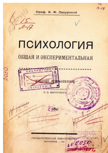
Рисунок 2 – Лазурский А.Ф. Психология общая и экспериментальная. Ленинград. 1925. КОИКМ. Отд. IX. КП