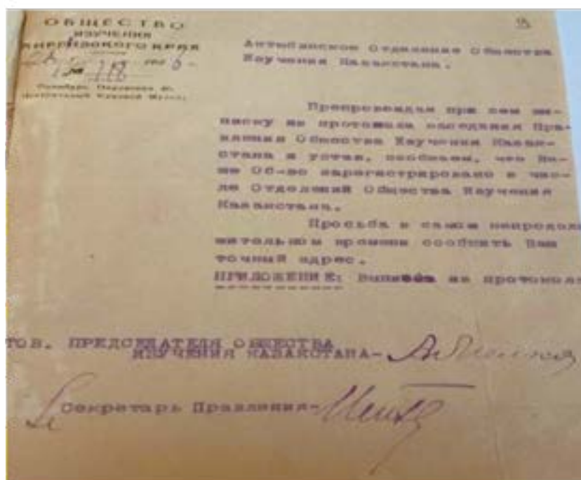
Рисунок 1 – Выписка из протокола заседания Общества