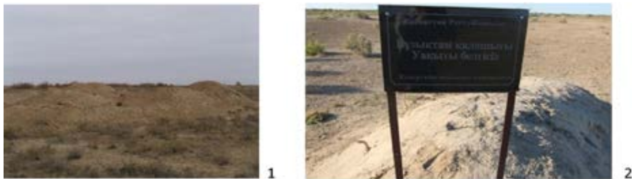
1-сурет – Бұзықтам қалашығы