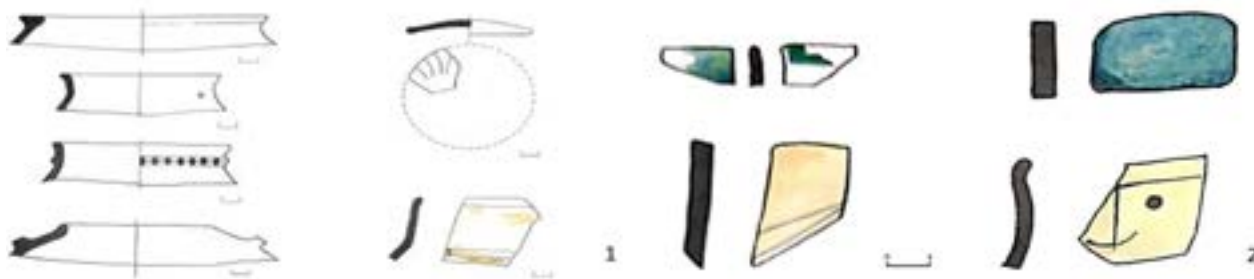
3-сурет – Қожақазған I (Қорғаншы) қамалынан табылған ыдыс сынықтары: