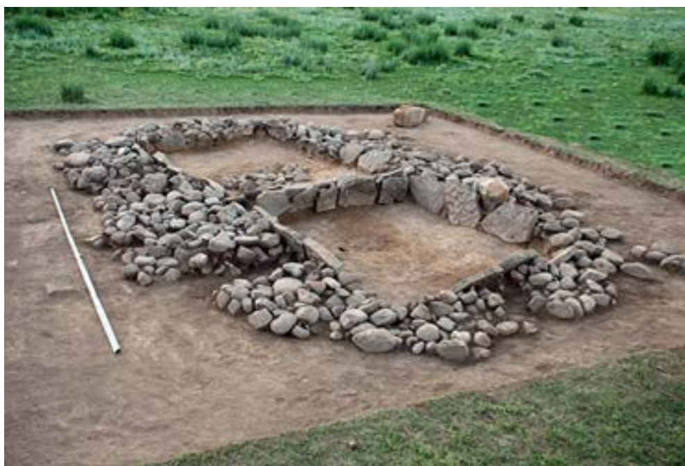
2-сурет – Үлкен Қақпақ қорымы. № 1 және № 2 ғұрыптық қоршаулар

тәрізді. Атап айтқанда, тастың төбесі жаңқалау тәсілімен өңделген және тарақтың іздері тәріздес тарам-тарам жолақтар бары байқалады. Ғұрыптық қоршаудың қабырғалары ұзындығы 0,8 м, биіктігі 0,4 м, қалыңдығы 0,1 м болатын жалпақ тастардан тұрғызылған. № 1 ғұрыптық қоршаудың шығыс жақ қабырғасына орнатылған төрт жалпақ тас өз орнында сақталған. Оңтүстік қабырғасында да төрт жалпақ тас сақталғаны анықталды. Батыс жақ қабырғасына бес жалпақ тас орнатылған және өз орнында сақталған. Солтүстік қабырғасында үш жалпақ тас сақталғаны және қабырғаға қойылған тастардың өз орнында болмағаны анықталды. Қоршаудың іші ірілі-ұсақты жұмыр тастармен толтырылған. Қоршаудың қабырғаларына қойылған жалпақ тақта тастардың барлығы сыртқа қарай шалқайғаны байқалады. Қоршау ішіне толтырылған тастардың салмағы ығыстырған болуы мүмкін. Қоршаудың шым қабатын тазалау барысында қоршаудың орталық бөлігінен, жұмыр тастардың арасынан ірі қара малының жамбас сүйектерінің кейбір бөліктері табылды. Қоршаудың шым қабаты тазаланғаннан кейін, жоспары сызылды және фотосуретке түсірілді. Ғұрыптық қоршаудың ішіне толтырылған жұмыр тастар толықтай алынып зерттеу жұмыстары жүргізілді. Жүргізілген археологиялық қазба жұмыстарының нәтижесінде қоршаудан заттай деректер табылмады.