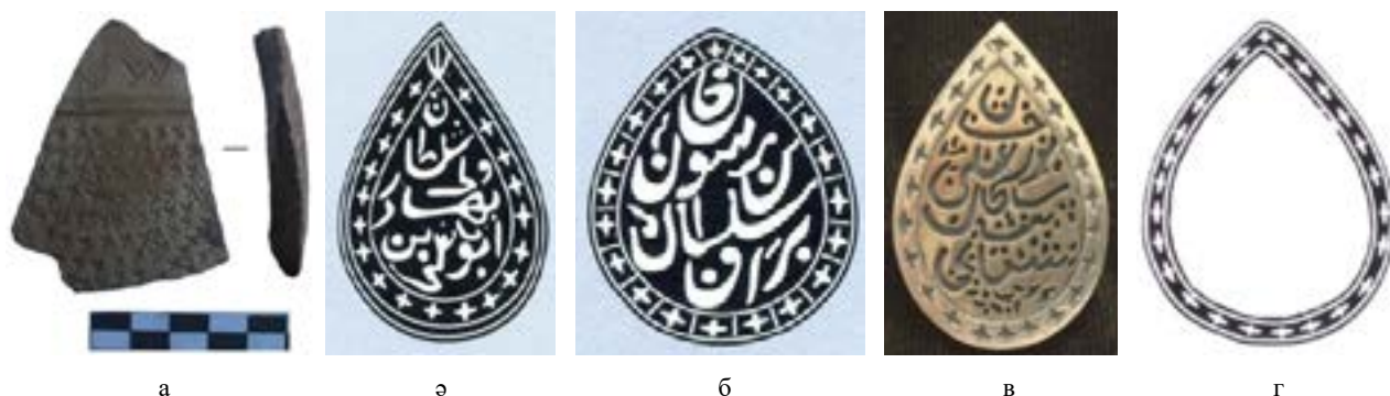
17-сурет – а) Қышқала керамикасындағы жұлдыз және ирексу өрнегі; б) Абылай ханның (1771 – 1780) мөрі; в) Барақ ханның (1749 – 1750) мәжіегіне, рі; г) Шығай сұлтанның (1812 – 1824) мөрі; г) мөр қорғанының графикасы

төрткүл, бескүл өрнектері. Өрнектің атты шартты түрде осылай аталып, ұштары үшкіл қырлы емес, гүл жапырағы секілді доғалданып бітеді.