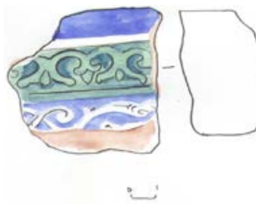
19-сурет – Қышқала мозайкасындағы қанатты қошқармүйіз оюы. М.Елеуов қазбасы