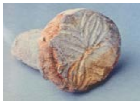
20-сурет – Мөр. Ортағасырлық Күйіккескен қалашығы. Қызылорда облысы тарихи-өлкетану музейі

Ортағасырлық Күйіккескен қаласынан табылған бірегей олжаның бірі – қатты күйдірілген қыш мөр. Рәміздер тарихында мөрлердің алатын орны ерекше. Қызылорда облысы тарихи өлкетану музейі бұл олжаны «жүзік» деп құжаттап, музейлік этикеткасын да осылай рәсімдеген. Негізінен мөр қолға ұстауға ыңғайлы тұғырмен жасалған. Мөр бетіндегі төрт жапырақ төрт тарапқа ашықтықты, яғни сыртқы қарым-қатынастарға, мемлекет аралық келісімдерге келуге ашықтықты білдіреді (Сурет 20).