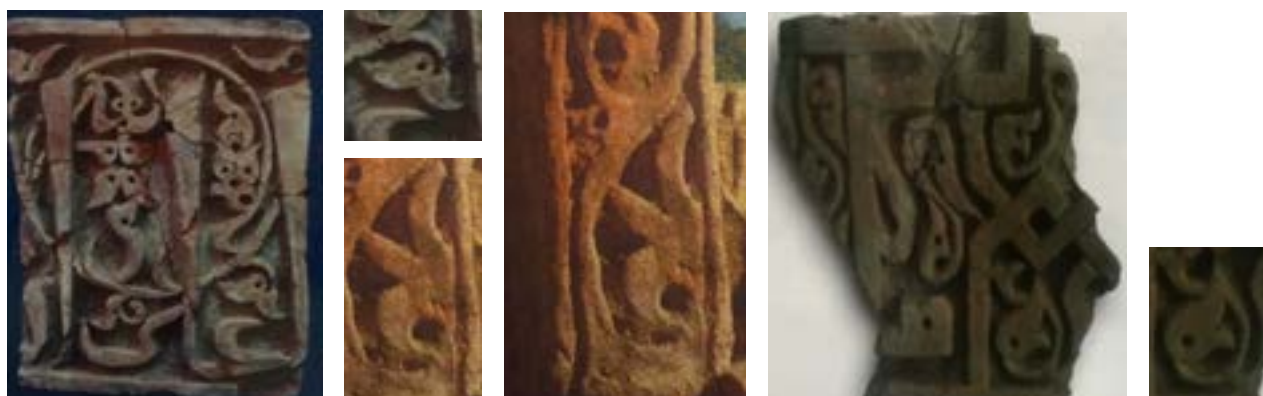
12-сурет – Ортағасырлық Қойлық қаласы терракота кірпішіндегі қызғалдақгүл өрнектері және фрагменттері

Қызғалдақгүл терракотасының озық үлгісінің бірі Ұлытаудағы Алтын Ордалық Болған Ана кесенесінің қыш кірпіші болып саналады (13-сурет).