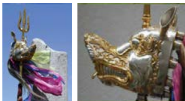
4-сурет – Бөрілі байрақ. Қ.Алтынбеков реконструкциясы.

Көкбөріге табыну түркі халықтарына ортақ таным екенін дәлелдейді. Азулы екі бөрінің тілдерінің ұштасып бейнеленуі бірлік пен татулықты символ ету, ал азуды айқара ашу, жауға қарсы айбат шегу, жаудың мысын басу. «Алла» жазуы бар түбі доғалданып келген құсмұрынды байрақ бөлігінің бөрі басы қоршауы ішіне бекітілуі исламға дейінгі тотемдік реликтің исламдық сеніммен астасып кетуінің дәлелі. Бұл ескерткіш бөрілі байрақтың ерте түркілік кезеңде ғана, ортағасырларда да қолданыста болғанын дәлелдейді. Алтын Орда кезеңіндегі бөрі культінің, бөрі тотемінің түп-тамыры, архисемасы ерте кезеңде жатыр.