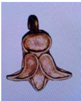
15-сурет – Қызғалдақгүл алтын бойтұмар. Шірік-Рабат. Ж.Құрманқұлов қазбасы