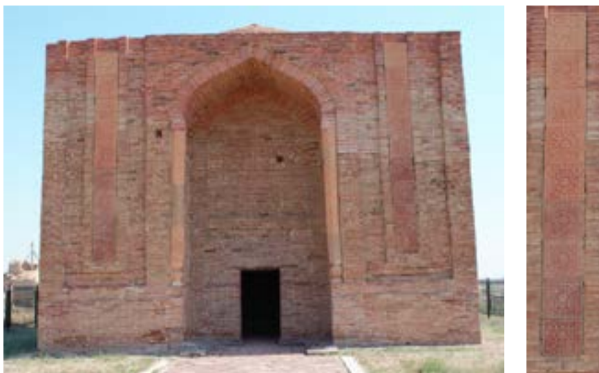
9-сурет – Алаша хан мазарының хас бетіндегі терракота кірпіш