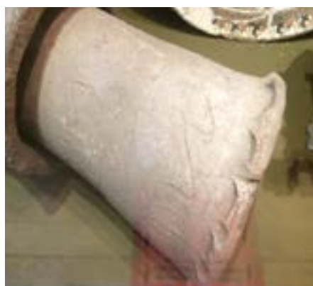
18-сурет – Ортағасырлық қыш құбырадағы ирексу өрнегі. ҚРҰҒА. Археология музейі