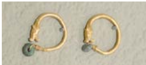
7-сурет – Бөрі басты Алтын Ордалық алтын сырға. Кердері кесенесі. XIV ғасыр. Қызылорда облыстық тарихи-өлкетану музейі

тұрмысында тастарға деген оң көзқарас бүгінге дейін сақталып отыр.