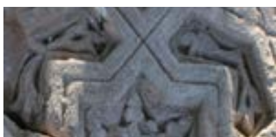
10-сурет – а) Алаша хан кесенесінің терракота кірпіші; ә) Айша бибі кесенесінің терракота кірпіші. ҚРҰҒА. Археология музейі