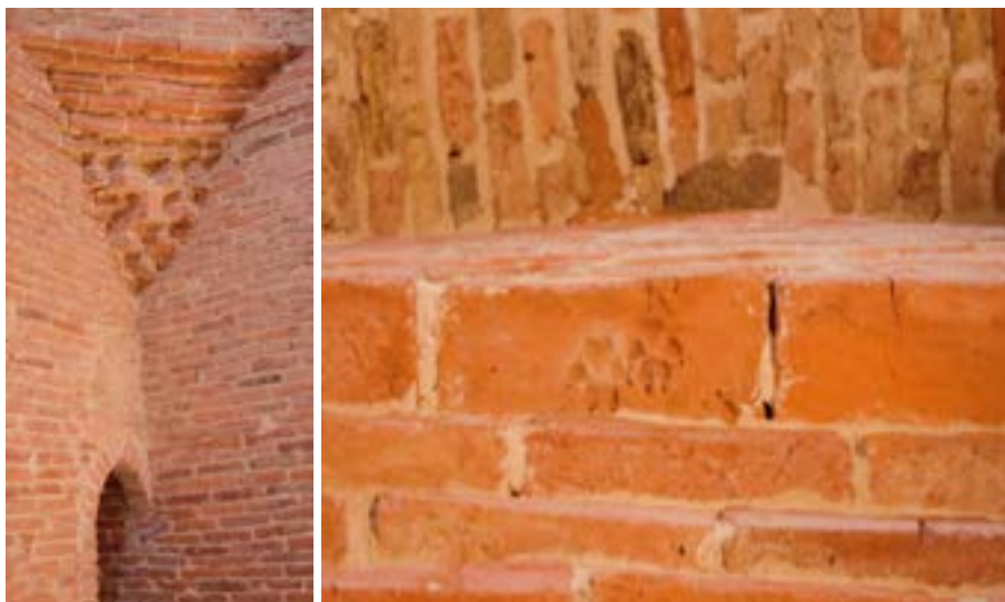
1-сурет – Алаша хан кесенесі мінберіне шығар есіктің жоғары тұсына қалаған кірпіштегі қасқырдың ізі.