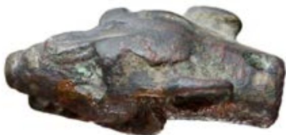
5-сурет – Бөрі басты ұштама. ҚРМOM

маңыздылығын негізге алсақ, бөрілі қамшының билеуші тұлғаға тиесілі болуы мүмкін (5-сурет).