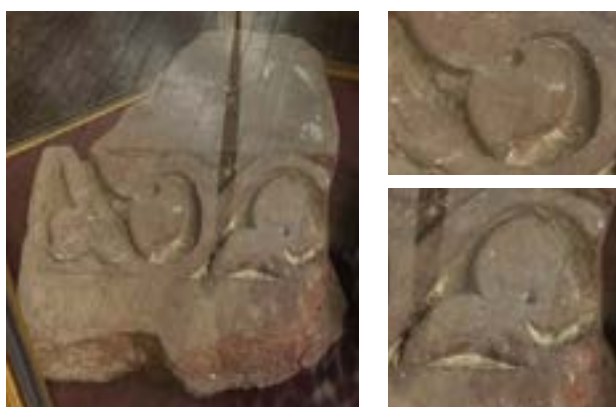
13-сурет – Алтын Ордалық Болған Ана кесенесі терракотасы, фрагменттерімен. XII-XIII ғғ. Ұлытау. ҚРМОН. Археология залы

Қышқала мозайкасындағы екі басы қызғалдақ гүлмен тұйықталған өрнектің мәні ерекше. Мұндағы қызғалдақтардың бір басы жерге, бір басы көкке тартылып, екі қауыздың сабағы арқылы жалғасуы, бір адамның өмір жолы секілді.