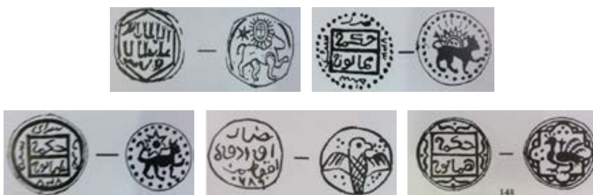
21-сурет – Сарайшық монеталарындағы тотемдік символдар. З.Самашев қазбасы

арыстан, барыс сияқты жыртқыш аңдардың басының қайырылып немесе алысқа қарағандай мойнын созып салуы олардың көкке ұмтылуын, алып күш иесінің, табиғаттағы билеуші күш екендігінің, яғни билік атрибуты болғандығының белгісі (Самашев, т.б., 2006; Сурет 21). Сондай-ақ арыстың аспан денесімен бірге салынуы Маңғыстаудағы ортағасырлық кесене қабырғаларында кездесуі, ортағасырлық мәдениеттегі ортақ танымды дәлелдейді