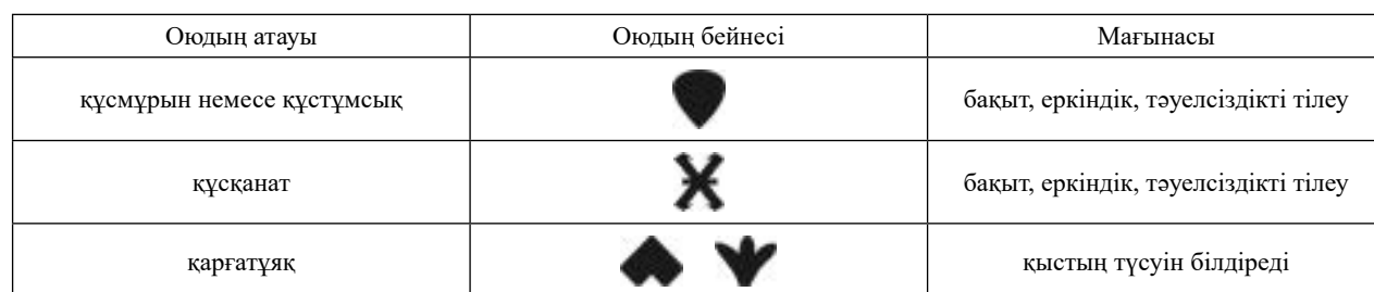
1-кесте – Құспен байланысты ою-өрнек

«Құстұмсық» – халқымыздың азаттық туралы түсінігін білдірген белгі. Құстың тұмсығына ұқсас қиылған оюмен әшекей бұйымдар да, үй жабдығы да безендірілген. Сонымен қатар еркіндіктің белгісі ретінде «құсқанат» оюын қанатын жайып ұшып келе жатқан құстың бейнесінде өрнектеген. Халық ауыз әдебиеті сияқты бағзы заманнан келе жатқан халықтың дүниетанымынан туған ою-өрнекті қазіргі күні сақтау қолға алынған. Тіпті кейбір дизайнерлер заманауи киім, жиһаз және т.б. пайдаланып, мүмкіндігінше жаңғыртуда. Дегенмен, болашақ ұрпақты тәрбиелеуде ою-өрнекті өрнектеп қана қоймай, оның мазмұнын жеткізу де маңызды.