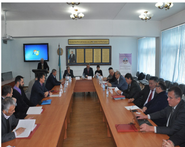
1-сурет – Конференция

2016 жылы Алматы облысы, Жамбыл ауданына қарасты Сұңқар ауылдық округінде қазба жұмыстары өз жалғасын тапты. Қазба барысында қоладан, темірден, сүйектен жасалған қару-жарақтар мен қыш құмыралар қазылып алынды. Табылған жәдігерлердің барлығына дерлік «геоархеология» халықаралық ғылыми-зерттеу зертханасының археолог мамандары түрлі деңгейде сараптамалар жасау нәтижесінде, Қазақстан археологиясына елеулі жаңалықтар енгізді.