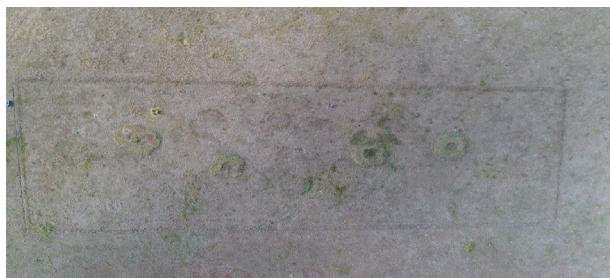
Рисунок 2 – План поселения Саркырама. Вид сверху

гольных очертаний, размерами примерно 3х2 м. Западины ориентированы широтно. Западины окружены широким грунтовым кольцом. Первоначально, по внешнему виду, объект был принят за средневековые погребальные оградки. В процессе раскопок выяснилось, что это развалы сырцовых жилищ.