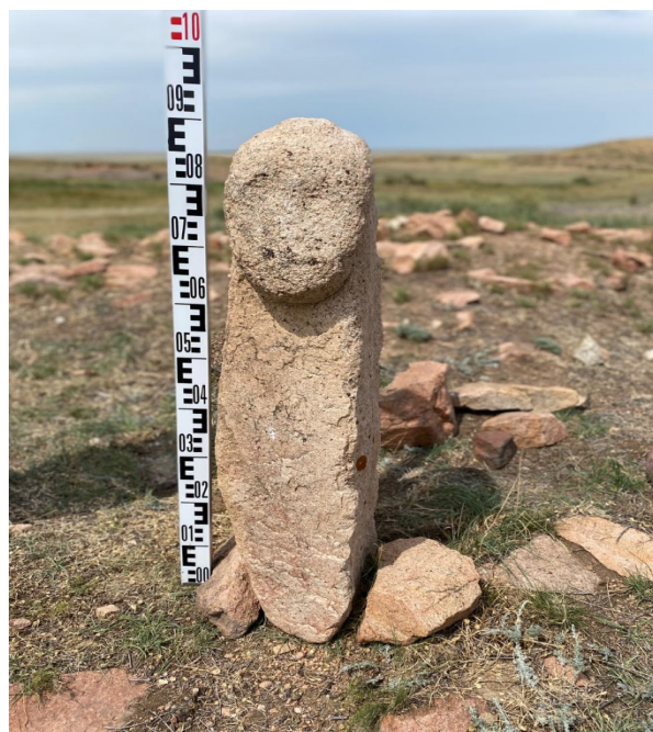
Рисунок 3 – Каменное антропоморфное изваяние №1

Каменное антропоморфное изваяние №2 расположено на небольшой возвышенности в 5,6 км юго-западнее зимовки Кусмурын, в 2 км западнее-юго-западнее р. Керей, в 8 км северно-западнее п. Аккола. Оно было расположено на поверхности курганной насыпи с восточной стороны. Его размеры 1,2*0,3 м. Лицевая часть сердцевидной формы, ярко выражены надбровные дуги, глаза. Нос и губы представлены небольшими продолговатыми углублениями. На торсе можно заметить два барельефных кружка – выраженные женские признаки (Кукушкин, ... 2016:50).